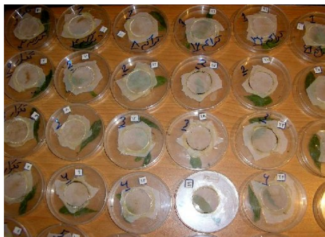
شکل ۱: ظروف استفاده شده در آزمایش واکنش تابعی