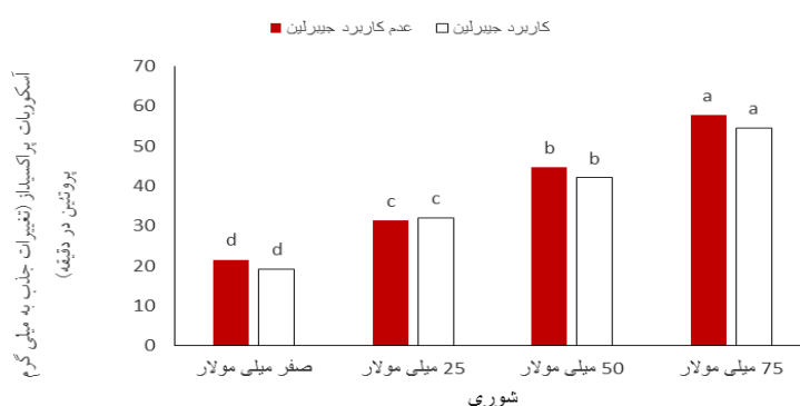
شکل ۵- مقایسه میانگین اثر متقابل دوگانه شوری در جیبرلین بر آسکوربات پراکسیداز

البته از لحاظ آماری بین کاربرد و عدم کاربرد جیبرلین در عامل ۷۵ میلی مولار شوری بر فعالیت آنزیم آسکوربات پراکسیداز اختلافی مشاهده نشد و هر دو حالت در یک گروه آماری قرار گرفتند (شکل ۵). نتایج اثر متقابل دوگانه جیبرلین و آسکوربات نشان داد که میزان فعالیت آنزیم APX در کلیه حالت های کاربرد و عدم کاربرد این دو عامل با یکدیگر در یک گروه آماری قرار گرفتند، اگر چه از لحاظ آماری بیشترین میزان فعالیت این آنزیم در حالت عدم کاربرد آسکوربات و عدم کاربرد جیبرلین به دست آمد که معادل ۴۲/۴۳ (تغییرات جذب بر حسب میلی گرم پروتئین در دقیقه) بود (شکل ۶). در آزمایشی که بر روی دو رقم سویا در زمان کاربرد آسکوربات و تنش شوری انجام گرفت، نتایج نشان داد که کاربرد اسید آسکوربیک باعث کاهش فعالیت آنزیم SOD در گیاهان کامل هر دو رقم شد (۲۲).