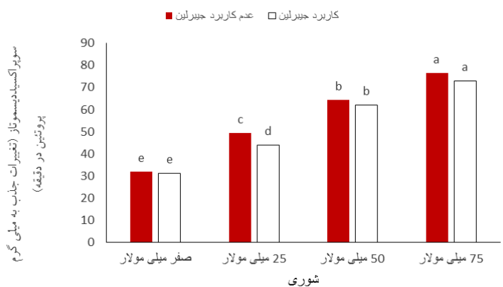
شکل ۲- مقایسه میانگین اثر متقابل دوگانه شوری در جیبرلین بر سوپر اکسید دیسموتاز