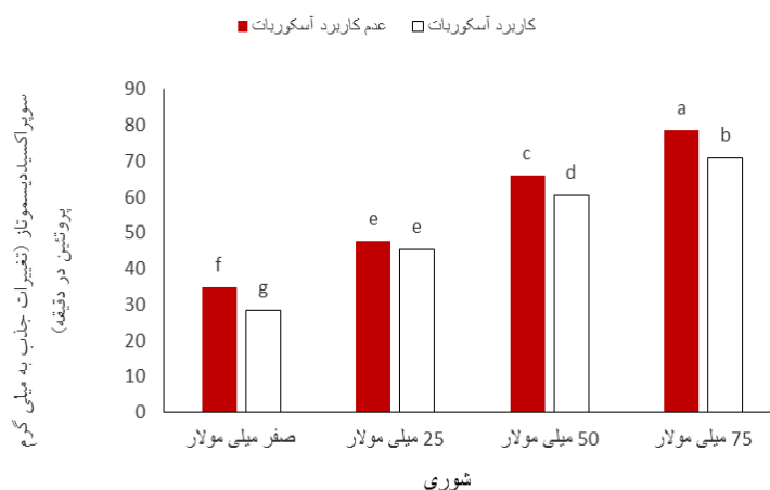
شکل ۱- مقایسه میانگین اثر متقابل دوگانه شوری در آسکوربات بر سوپراکسید دیسموتاز

همچنین بررسی مقایسه میانگین اثر متقابل شوری و جیبرلین نشان داد که بیشترین میزان فعالیت آنزیم SOD در عامل ۷۵ میلی مولار نمک بدست آمد که مقدار بدست آمده در هر دو شرایط کاربرد و عدم کاربرد جیبرلین در یک گروه آماری قرار گرفتند که این مقدار برای عدم کاربرد جیبرلین و کاربرد شوری معادل ۷۶/۵۳ و برای کاربرد جیبرلین با تنش شوری معادل ۷۳/۰۲ (تغییرات جذب به میلی گرم پروتئین در دقیقه) حاصل شد (شکل ۲). قابل ذکر است که در گیاه مریم گلی با اعمال تنش شوری، به منظور مقاومت در برابر تنش فعالیت آنزیم SOD بیشتر از بقیه آنزیم‌های آنتی اکسیدانی افزایش یافت.