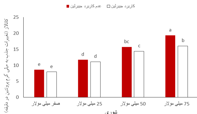
شکل ۳- مقایسه میانگین اثر متقابل دوگانه شوری در جیبرلین بر کاتالاز

مصرف هورمون جیبرلین به دست آمد، همچنین قابل ذکر است که در هر کدام از غلظت‌های نمک کمترین میزان فعالیت این آنزیم در شرایط کاربرد هورمون جیبرلین به دست آمد (شکل ۳).